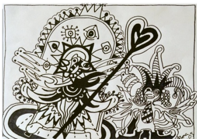
Illustration. Välj en text som berör dig och bilda den fritt ur hjärtat. Du kan även låta musik inspirera dig. Arbeta fram en färdig bild i valfri teknik.

Skulptur. Arbeta med lera eller annat material och forma ett huvud, formge en tanke eller en idé ("mötet", "liten och stor!", "vänskap" etc.) . Du kan även jobba med reliefer eller forma små föremål som du placerar i en spännande miljö och fotograferar.