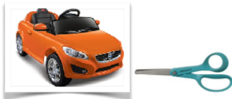
Foto från nätet - Skriv ut i den storlek du vill ha och klipp ut till rätt form. Skall passa din layout.