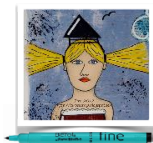
Svart tuschpenna till konturer.