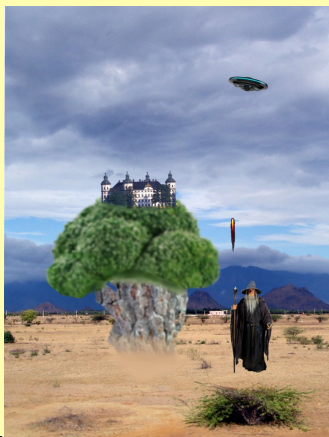
kombinerar former, färger och bildkompositioner på ett

Hur medvetet och avancerat du använder färger och former för att skapa uttryck och effekter i din bild. Det kan t.ex gälla hur du använder varma och kalla färger, hur färgerna stämmer överens med budskapet, samt hur formerna fungerar som helhet i din bild.